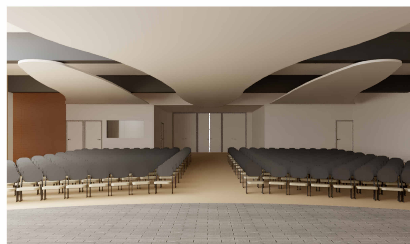
Render 3D interior salón múltiple/ Auditorio